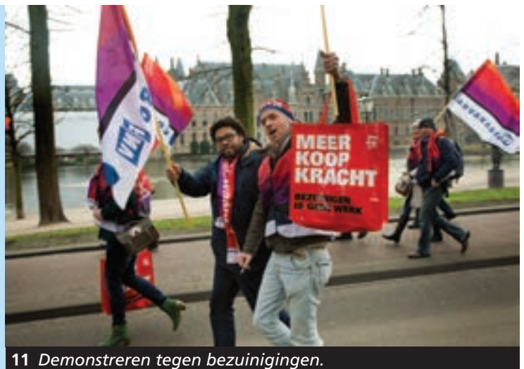
11 Demonstreren tegen bezuinigingen.

De politieke partijen die in de regering zitten, bepalen waar de regering het geld aan uitgeeft. Sommige partijen willen bijvoorbeeld graag meer uitgeven aan gezondheidszorg en onderwijs. Dat kan, maar dat geld moet ergens vandaan komen. De regering zou bijvoorbeeld de belastingen kunnen verhogen of nog meer kunnen lenen. Andere partijen vinden dat we moeten bezuinigen, want anders wordt de schuld nog groter. Maar de mensen die last hebben van die bezuinigingen, zijn daar natuurlijk niet blij mee.