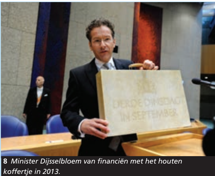
8 Minister Dijsselbloem van financiën met het houten koffertje in 2013.

Na de toespraak van de koning gaat de minister van Financiën naar de Tweede Kamer. Hij heeft een speciaal houten koffertje bij zich. In de Tweede Kamer doet hij het koffertje open en haalt hij de miljoenennota eruit. Dat kan een pak papier zijn, maar ook een cd of een usb-stick. Daarna houdt hij een presentatie over de financiële plannen van de regering. Hij vertelt wat er in de miljoenennota staat, wat er met de belastingen gebeurt, waar op bezuinigd moet worden en waar meer geld naartoe gaat. Het verhaal van de minister sluit mooi aan bij de Troonrede van de koning. Dat is niet toevallig: de Troonrede is geschreven door de regering.