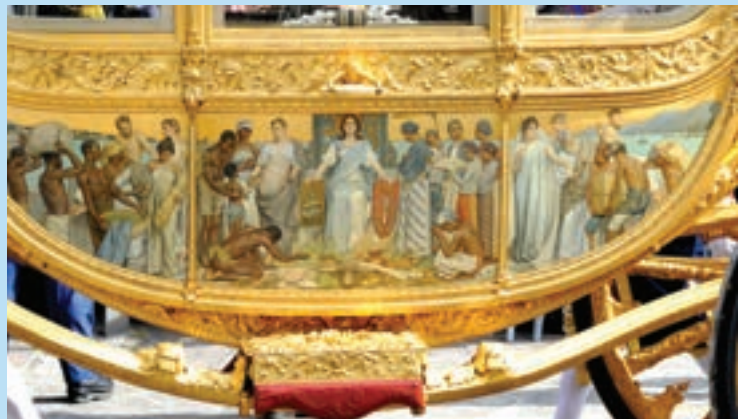
5 Afbeelding op de Gouden Koets.