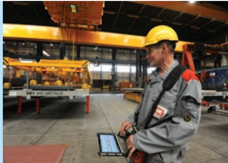
12 Dankzij computers en machines kunnen mensen meer werk doen dan vroeger.

We geven met z'n allen meer uit dan vroeger, maar we verdienen ook meer. Doordat we veel computers en machines gebruiken, werken we sneller en produceren we meer. Dankzij alle opleidingen hebben we ook betere banen. Er zijn meer managers, programmeurs en designers dan vroeger. Eenvoudiger werk wordt nu vaak door machines of in het buitenland gedaan. Tussen 1983 en nu verdubbelde het gemiddelde inkomen van mensen. Dat wil niet zeggen dat mensen ook twee keer zo rijk zijn: alles werd ook veel duurder. Maar toch steeg de welvaart. Nu kunnen veel meer mensen dan in 1983 een groot huis, een mooie auto of een dure vakantie betalen.