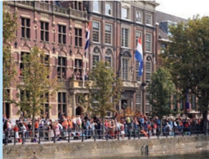
6 Mensen langs de route van de Gouden Koets.

Op Prinsjesdag haalt de koets de koning en koningin op bij Paleis Noordeinde in Den Haag. Daarna gaat de koets naar het Binnenhof. De koets rijdt niet alleen: het is een hele optocht met lijfwachten in mooie uniformen, lakeien, ruiters en andere koetsen. Langs de route staan duizenden mensen die allemaal met vlaggetjes zwaaien. De hele tocht duurt een kwartier. Tijdens de tocht vuurt een kanon op het Malieveld in Den Haag elke minuut een saluutschot af. Na de toespraak in de Ridderzaal, gaat de stoet weer terug naar het paleis. De koning en koningin verschijnen dan nog op het balkon en zwaaien naar de mensen.