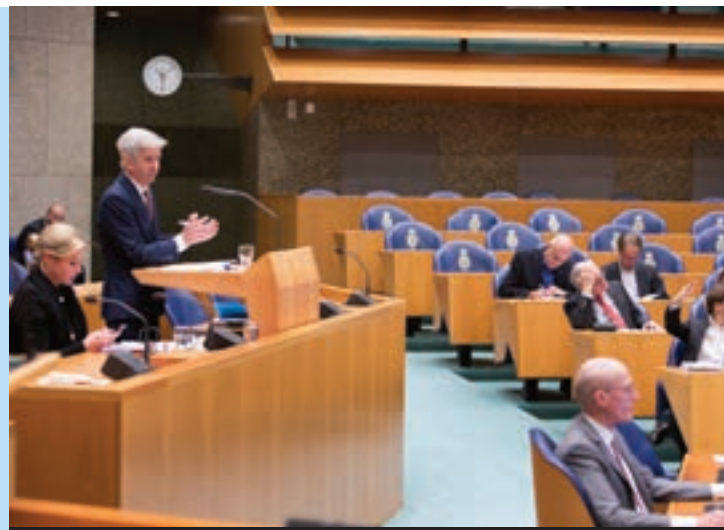
10 Bezuinigen of niet? Dat beslist de regering.

In de meeste jaren heeft Nederland een begrotingstekort. Dat betekent dat de regering meer geld uitgeeft dan er binnenkomt. Het geld dat we tekort komen, moeten we lenen. Daardoor hebben we nu een flinke schuld. Elk jaar betalen we daar miljarden euro's rente over. Om de schuld niet groter te laten worden, willen sommige partijen bezuinigen. Maar als we bezuinigen, hebben mensen minder geld. En mensen met minder geld geven minder uit. De regering krijgt dan minder geld uit btw en andere belastingen. Daarom vinden andere politieke partijen dat we juist niet moeten bezuinigen.