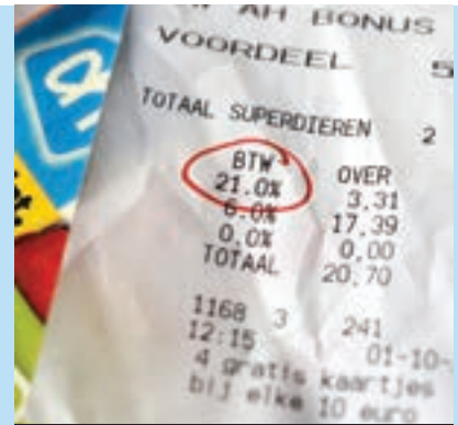
9 Als je iets koopt, betaal je btw.

Het meeste geld dat de regering krijgt, komt uit belastingen. Als je werkt, gaat een deel van je loon naar de regering. Dat is loonbelasting. Bedrijven betalen omzetbelasting. Verder betaal je steeds belasting als je iets in een winkel koopt. Dat heet btw. Van de belastingen worden allerlei dingen betaald: wegen, de politie, stadsparken, de vuilophaaldienst en veel meer. De allergrootste kostenpost is de gezondheidszorg: ziekenhuizen, huisartsen, verpleeghuizen en dergelijke. Ook het onderwijs kost veel geld.