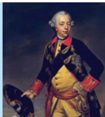
2 Vroeger was Prinsjesdag de verjaardag van Willem V.