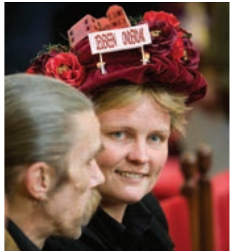
13 Demonstratie tegen dakloos zijn met een hoed.