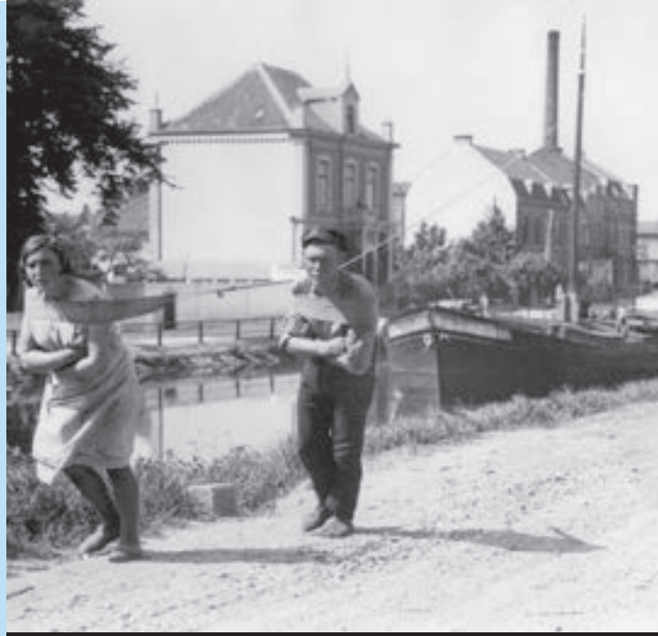
3 Een trekschuit.

Op Prinsjesdag presenteert de minister van Financiën de miljoenennota. Daarin staan de plannen voor het volgende jaar. Vóór 1 januari moeten alle leden van de Eerste en de Tweede Kamer zeggen wat ze van de plannen vinden. De regering moet naar al die reacties luisteren en erop reageren. Dat kost allemaal veel tijd. Daarom moet de regering de plannen al in september bekend maken. Lang geleden gebeurde dat op maandag. Dat was onhandig, want regeringsleden moesten uit het hele land naar Den Haag komen. Het vervoer was toen nog lang niet zo goed als nu. Tot in de 20e eeuw reisden mensen vooral met koetsen en trekschuiten. Om op tijd te zijn, moesten ze al op zondag vertrekken, maar dat mocht niet vanwege het geloof. Dinsdag was dus handiger.