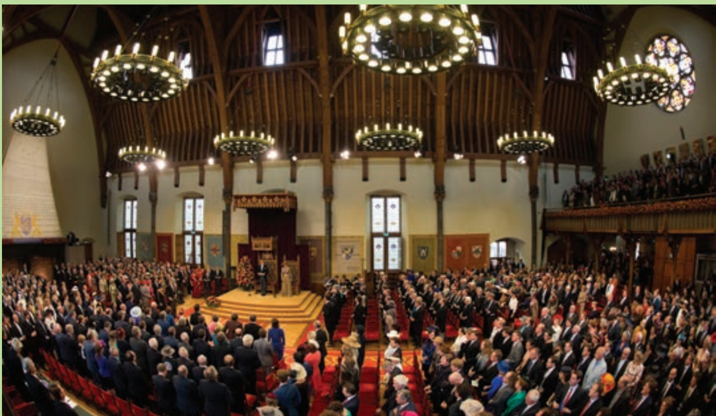
1 De Troonrede in de Ridderzaal.

Op Prinsjesdag is niet alles zoals het lijkt. Zo is de Gouden Koets helemaal niet van goud. Ook gaat de miljoenennota niet over miljoenen maar over miljarden. De troonrede van de koning is helemaal niet van de koning zelf: hij leest hem alleen maar voor. En waarom heet het eigenlijk Prinsjesdag, terwijl het helemaal niet om prinsjes gaat?