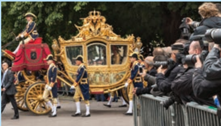
4 De Gouden Koets onderweg naar het Binnenhof.

Op de koets staan allerlei afbeeldingen. Op één afbeelding staan donkere mensen met weinig kleren aan die knielen voor het koningshuis en geschenken aanbieden. De afbeelding is gemaakt in de tijd dat Nederland nog kolonies had en daar heel trots op was. Sommige mensen vinden dat deze afbeelding van de koets af moet omdat hij discriminerend is.